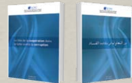
دور التعاون في مكافحة الفساد : أكتوبر 2011