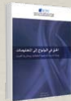
الحق في الولوج إلى المعلومات . بوابة أساسية لتدعيم الشفافية و محاربة الفساد : شتنبر 2012