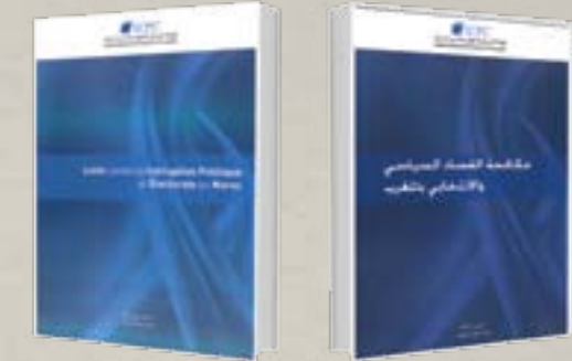
مكافحة الفساد السياسي و الإنتخابي بالمغرب