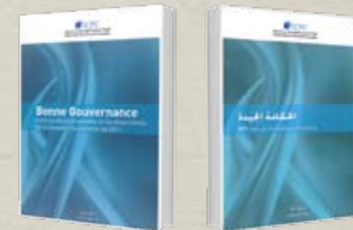
الحكمة الجيدة بين الوضع الراهن و مقتضيات الدستور الجديد 2011 : يونيو 2011