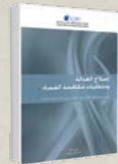
إصلاح العدالة و متطلبات مكافحة الفساد. تقرير مرفوع للهيئة العليا للحوار الوطني حول إصلاح منظومة العدالة : يونيو 2012