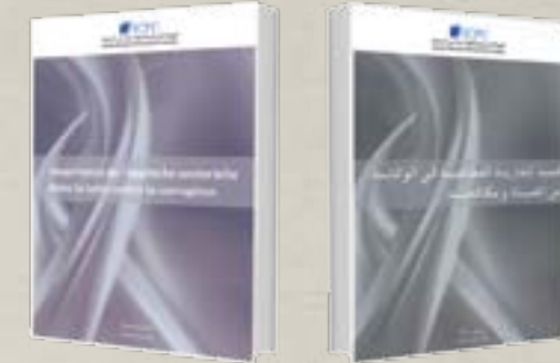
أهمية المقاربة القطاعية في الوقاية من الفساد و مكافحته : أكتوبر 2011