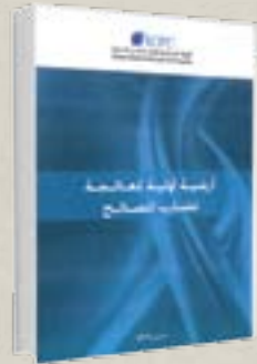
أرضية أولية لمعالجة تضارب المصالح : دجنبر 2012